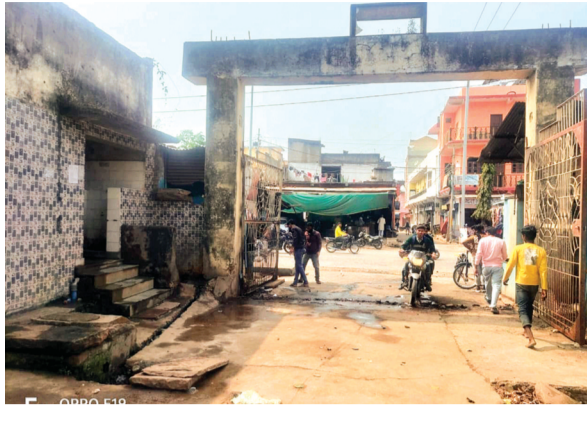
हरिभूमि न्यूज गंजबासोदा

त्नोंद रोड स्थित पुरानी गल्ला मंडी प्रांगण में पांचवां पंचकल्याण महोत्सव आगामी 24 फरवरी से 2 मार्च तक आयोजित होने जा रहा है। जिसके लिए नया एवं प्रशासनिक अमले ने बुधवार को पुरानी कृषि उपज मंडी जाने के लिए दूसरा गेट पर किए गए अतिक्रमण को हटाकर गेट खुलवा दिया। जिससे नवीन अस्पताल के आसपास फुटकर सब्जी बाजार के लिए सुविधा होगी।