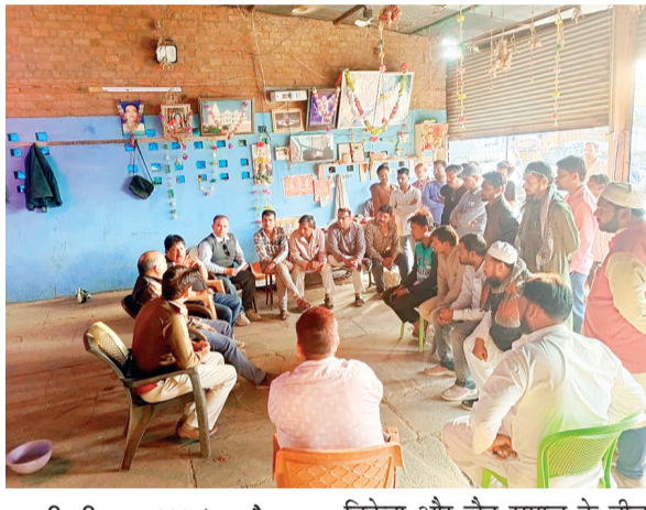
हरिभूमि न्यूज गंजबासोदा