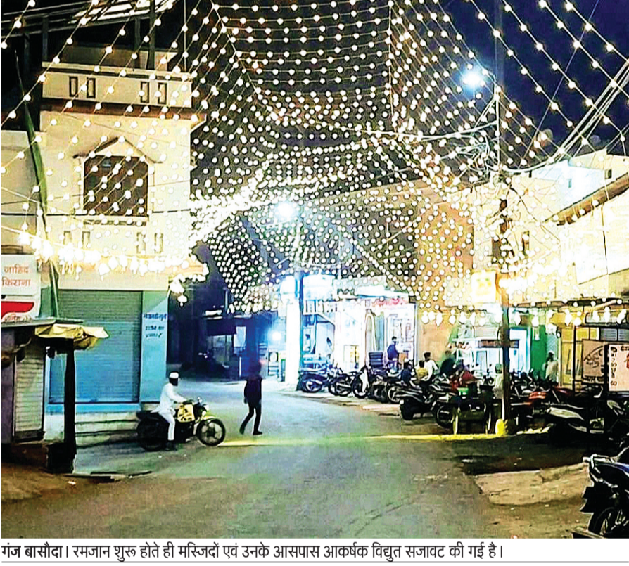
गंज बासोदा। रमजान शुरू होते ही मस्जिदों एवं उनके आसपास आकर्षक विद्युत सजावट की गई है।