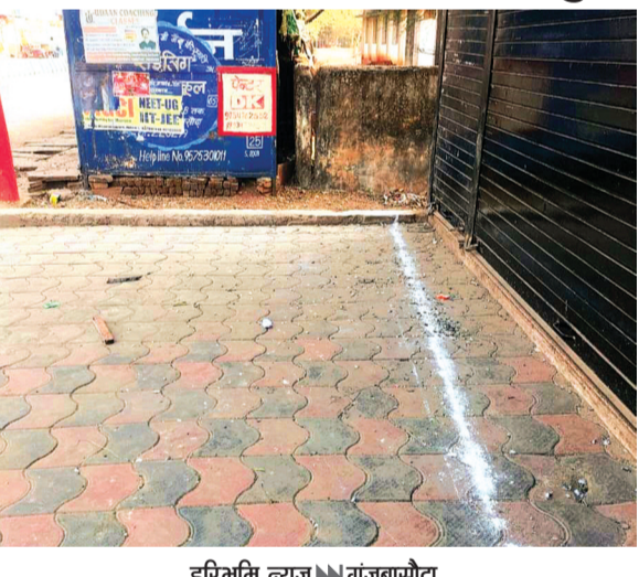
हरिभूमि न्यूज गंजबासोदा

मिनी स्मार्ट सिटी योजना के तहत नगर के वार्ड क्रमांक 7 बरेट रोड पर शासकीय संजय गांधी स्मृति स्नातकोत्तर महाविद्यालय से नाला का निर्माण कार्य हेतु संबंधित ठेकेदार द्वारा नाला निर्माण के लिए चुनी की लाइन डालकर खुदाई एवं नाला निर्माण का कार्य शुरू कर दिया गया है। इसी को लेकर नया अमले को मौजूदगी में बरेट रोड पर चूने की लाइन डाली गई।