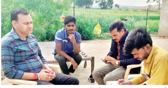
हरिभूमि न्यूज || सिरोंज

विमुक्त घुमंतु और अर्द्धघुमंतु विभाग के मार्गदर्शन में मध्यप्रदेश जन अभियान परिषद के द्वारा सिरोंज विकासखंड में विमुक्त घुमंतु एवं अर्द्धघुमंतु जातियों जो राज्य सरकार द्वारा 51 समुदाय मान्यता प्राप्त परिवारों का सर्वे किया जा रहा है। इस सर्वे का उद्देश्य इन समुदायों की वास्तविक स्थिति, सामाजिक-आर्थिक आवश्यकताओं तथा शासन की योजनाओं से जुड़ाव की जानकारी एकत्र करना है। सर्वे के दौरान क्षेत्र के ग्रामों व बस्तियों में पहुंचकर परिवार-स्तर पर जानकारी ली जा रही है, जिसमें परिवार की संख्या, शिक्षा एवं आजीविका की स्थिति, आवास, राशन कार्ड, आयुष्मान कार्ड, पेंशन जैसी योजनाओं का लाभ, परिवार की शिक्षा आदि बिंदु शामिल हैं। जन अभियान परिषद की नवीकृत संस्था के कार्यकर्ता एवं प्रस्फुटन समिति के सदस्यों द्वारा यह कार्य गंभीरता से किया जा रहा है, ताकि विमुक्त, घुमंतु एवं अर्द्धघुमंतु समुदायों को शासन की योजनाओं का अधिकतम लाभ मिल सके और उन्हें मुख्यधारा से जोड़ने के लिए ठोस कार्ययोजना तैयार की जा सके। वहीं विकास खंड क्षेत्र में कोई भी पात्र परिवार सर्वे से वंचित न रह सके। यह सर्वे सिरोंज क्षेत्र में सामाजिक समावेशन व कल्याणकारी योजना की प्रभावी पहुंच में एक महत्वपूर्ण पहल है।